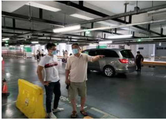
公司领导亲临停车库检查落实