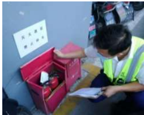
检查非机动车停车库消防器材