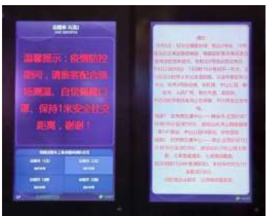
外场电子屏发布地铁加开信息

注意啦！今晚，地铁2号线虹桥火车站站延时营运至次日0时15分！另加开两条应急公交专线！