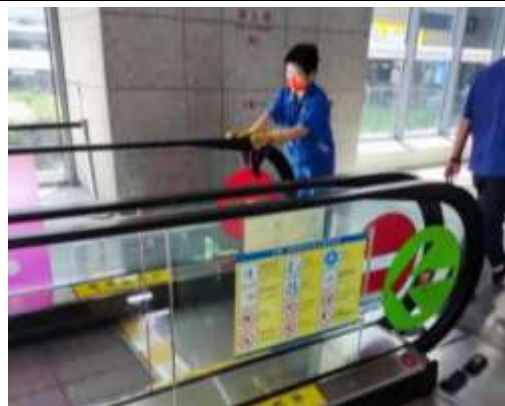
步道梯消毒杀菌工作