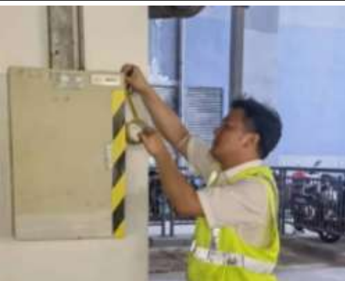
张贴安全隐患临时警示标识