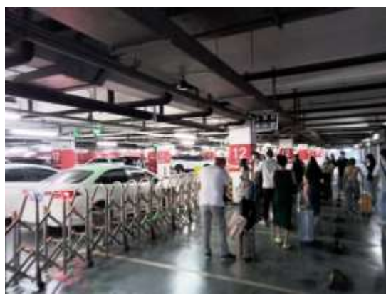
扩大旅客排队等候区域

虹桥枢纽公司高度重视，周密部署，压实责任，从严从实从细抓好维护安全稳定各项工作，顺利完成 2021 年国庆长假的客运任务，保障广大旅客安全出行。