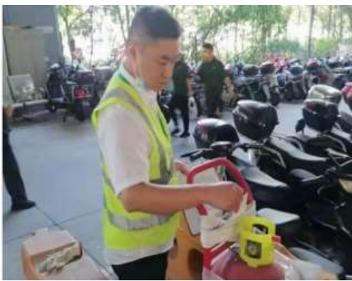
检查非机动车停车库消防设备